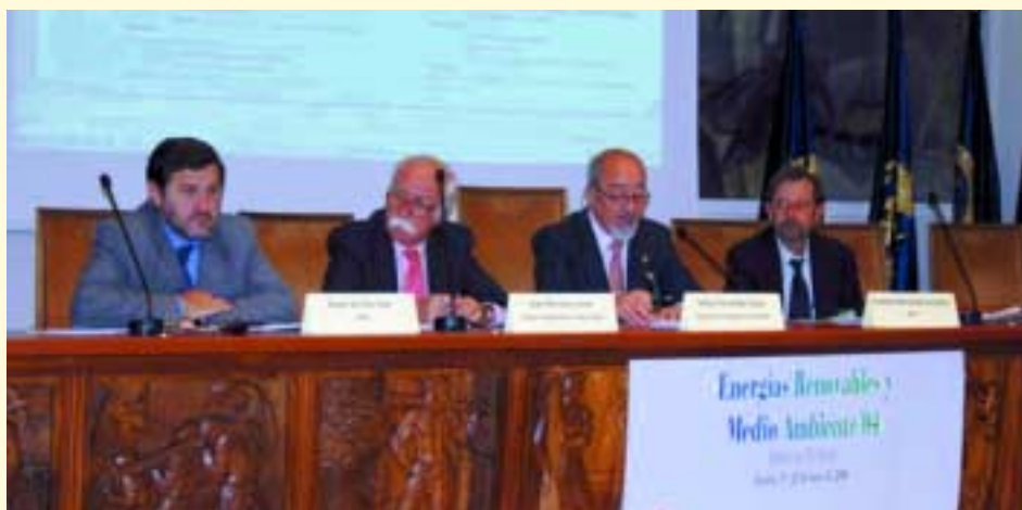
Momento de la celebración de las Jornadas en el IIE