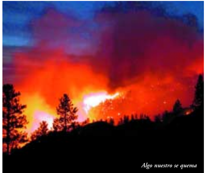
Algo nuestro se quema

Para nosotros es un grave error tratar el problema de los incendios forestales solamente bajo el punto de vista de la extinción, por muy sofisticados que los medios materiales empleados sean. Así