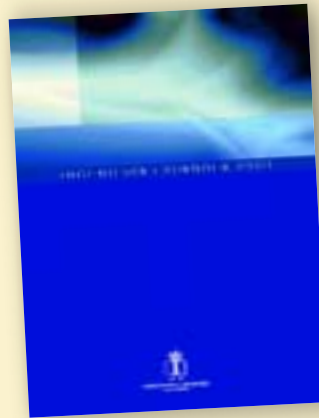
Informe de la Ingeniería española 2003

Hasta ahora, este Informe sólo estaba publicado en edición facsímil y en soporte electrónico. Esta nueva edición mejora sustancialmente la anterior, toda vez que, además de haber sido corregida y aumentada, incorpora una mejor calidad de papel y de impresión, según los estándares editoriales habituales para este tipo de publicaciones. Antes de su publicación, la segunda edición del Primer Informe de la Ingeniería ha recibido numerosas demandas de ingenieros, de empresas e instituciones y de medios de comuni-